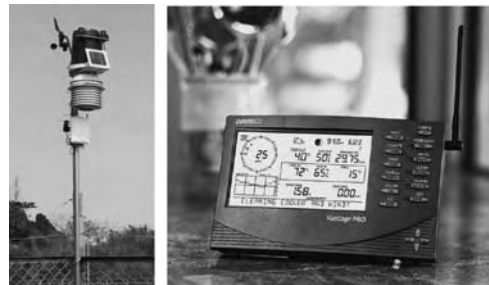
図 3 Vantage Pro Plus 左：測定ユニット、右：表示装置