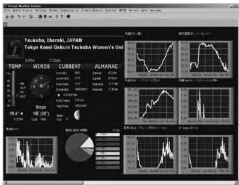
図 4 専用ソフト(Virtual Weather Station)を用いた観測画面の例

Vantage Pro Plus の観測データは、専用のソフトを使うことで、パソコン上に表示することができる。さらにホームページ用のデータの転送やメールでの観測データの転送ができるものもある。図 4 は米国 Ambient Weather 社の Virtual Weather Station の観測画面を示したものである。Virtual Weather Station は図 4 に見られるグラフデータや現在の観測データ、月齢などの気象情報をホームページで表示できる形式に加工し Web サーバーへ転送や、メールでのデータ転送(図 5)などが可能である。観測データをデータベース化する場合、数値形式のデータの方が扱いやすいので、図 5 のような形式の観測データを各観測地点からメールなどで送信し、データベースサーバー等で受信、加工し、データベース化すればよい。