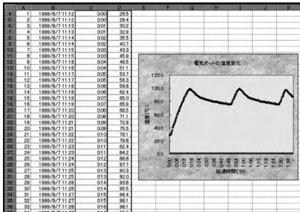
図2 小型測定装置による「ポットのお湯の温まり方・冷め方の実験」の測定データの電子化とExcelによる測定データの加工例